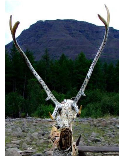
Drei Wächter am Lamasee, 2006, Detailansicht „Tier“, Fundstücke aus Holz und Rengeweih bemalt