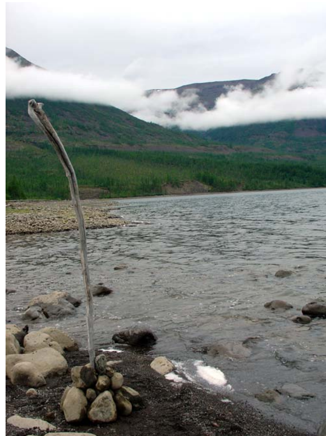
am Lamasee, 2006, Foto