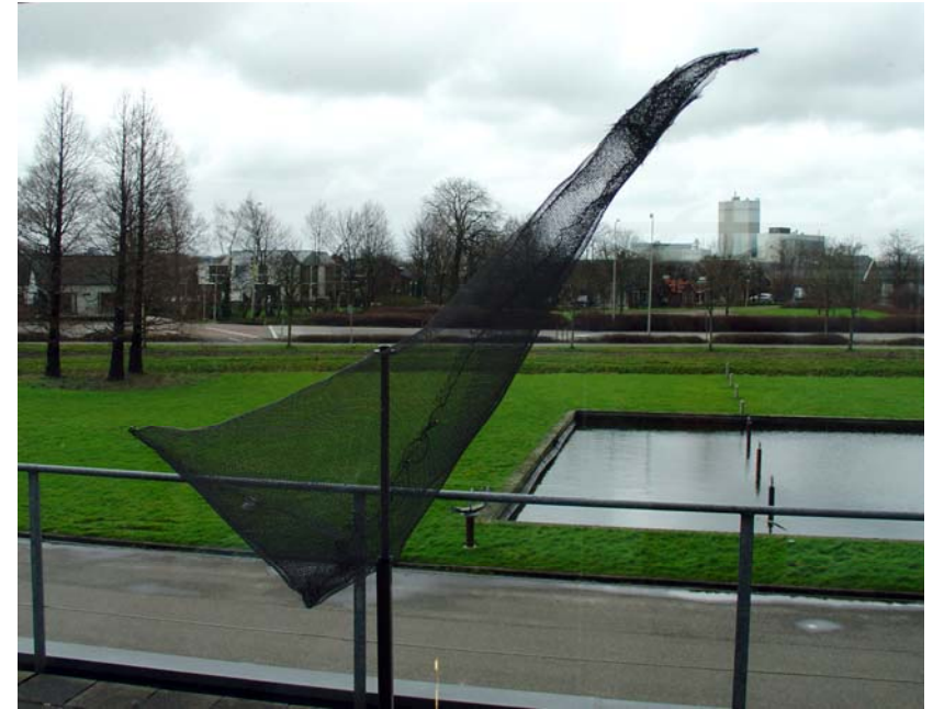
Vogel 3, 2006, Alugewebe, Edelstahlstab, Granit, 140 x 50 x 25 cm, Galerie Helga Hofman, NL, 2007