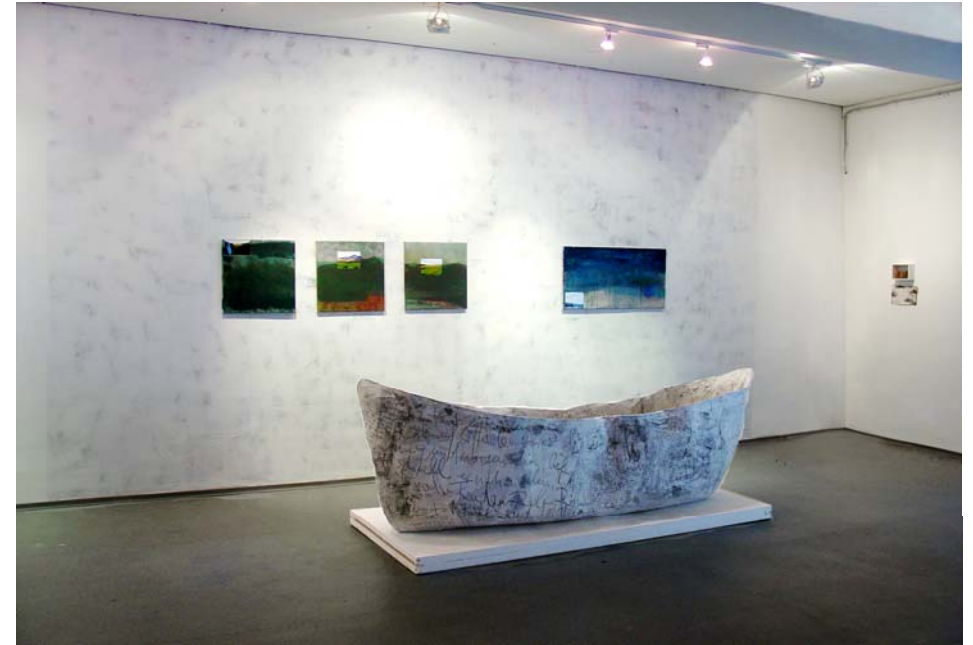
Von Ost nach West, 2005, Boot aus Papier, beschriftet, 100 x 300 x 85 cm, gestaltete Museumswand, 4 Arbeiten auf Lw., je 50 x 50 cm und 50 x 100 cm, Objektkasten mit Kiefernzapfen und Birkenrinde, Biennale VI, Museum für moderne Kunst, Krasnojarsk, Sibirien