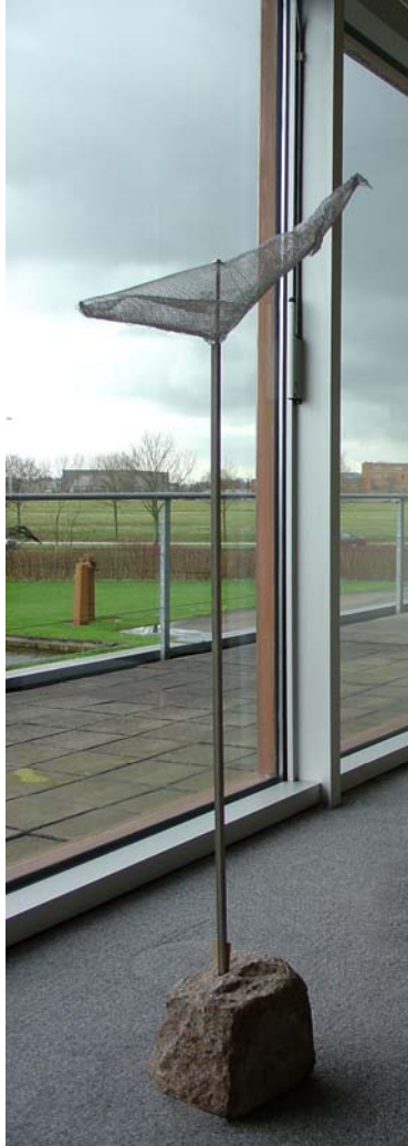
Vogel 2, 2006, Edelstahlgewebe, -stab, Granit, 100 x 30 x 25 cm, Galerie Helga Hofman, NL, 2007