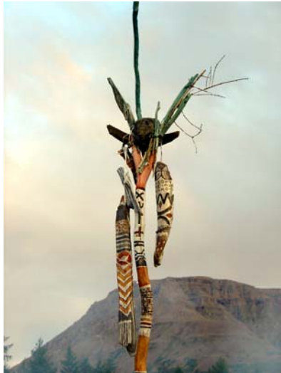
Wächter am Lamasee, 2006, Holz, Stein und Pflanzenteile bemalt, Detailansicht