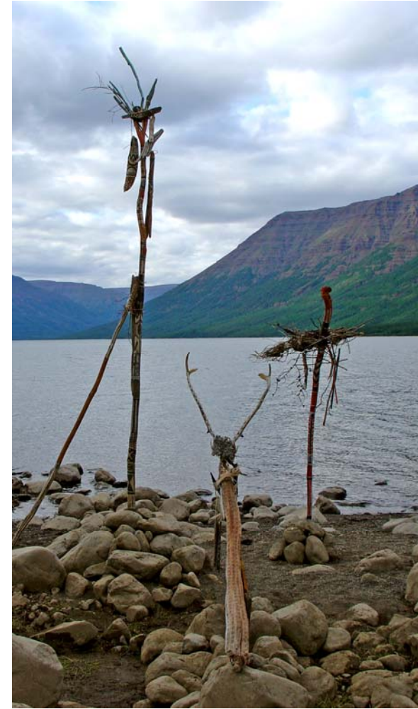
Drei Wächter am Lamasee, 2006, Fundstücke aus Holz, Pflanzenteile, Rengeweih bemalt, Gesamtansicht