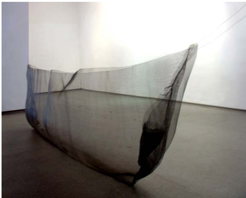
Von Ost nach West, 2005, Foto (1), Boot aus Drahtgeflecht, 100 x 300 x 85 cm Aufbau der Installation zur Biennale VI in Krasnoyarsk, Sibirien