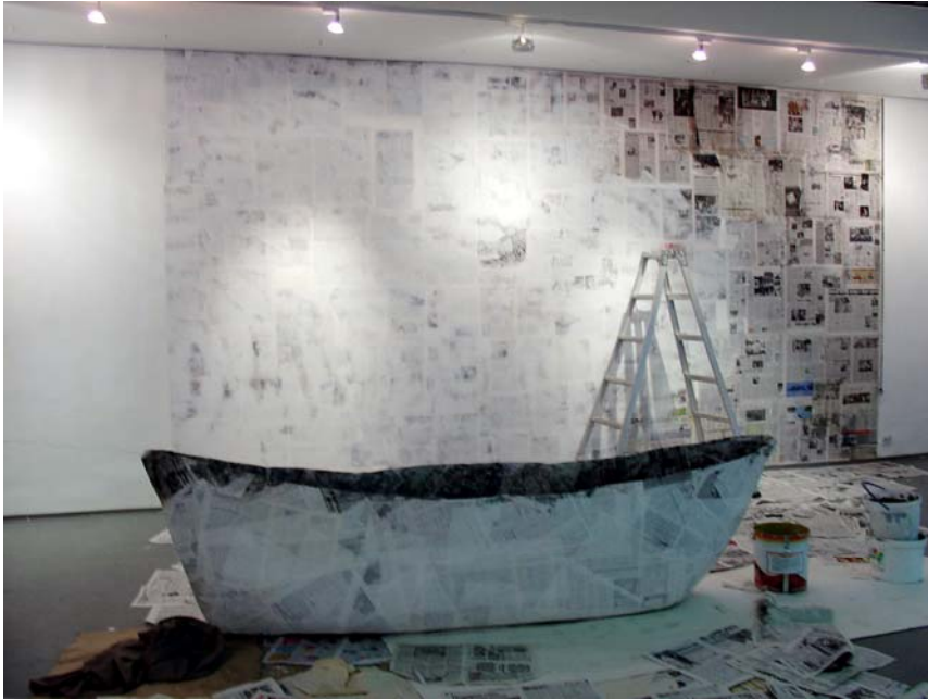
Von Ost nach West, 2005, Gestaltung der Museumswand mit sibirischen u. deutschen weiß lasierten Zeitungsseiten, Aufbau der Installation zur Biennale VI im Museum für moderne Kunst, Krasnoyarsk, Sibirien

Herausgeber: Gudrun Fischer-Bomert Hubertusweg 60, 13465 Berlin E-Mail: fibo-berlin@t-online.de www.fischer-bomert.de