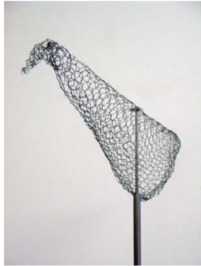
Vogel 5 und 4, 2006, Alugewebe, Zinkdraht, Stäbe, Granit, 235 und 185 cm hoch, Detailansicht