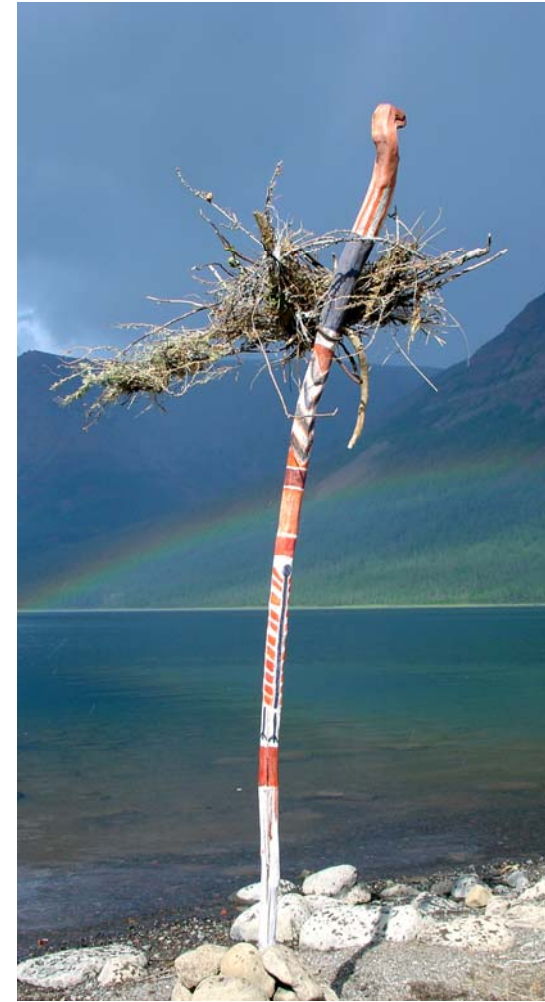
Das erste Objekt, Holzstücke bemalt, mit getrockneten Pflanzenteilen verbunden, wird später an einem aufgerichteten Teil der Installation befestigt, Detailansichten, Lamasee, Region Norilsk 2006