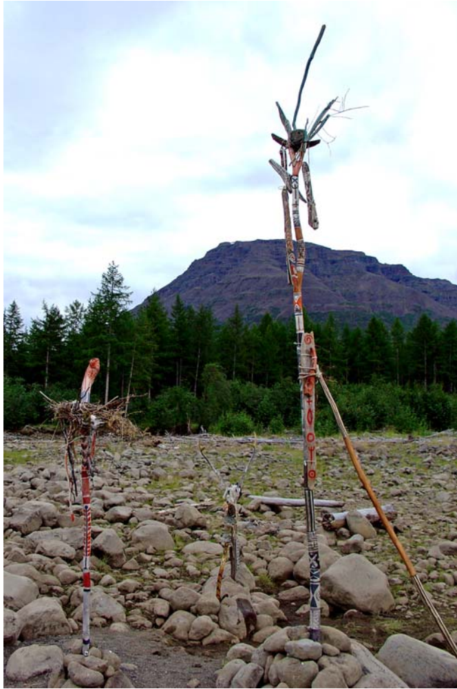
Drei Wächter am Lamasee, Region Norilsk, Sibirien 2006, Gesamtansicht, Höhe ca. 3,50m