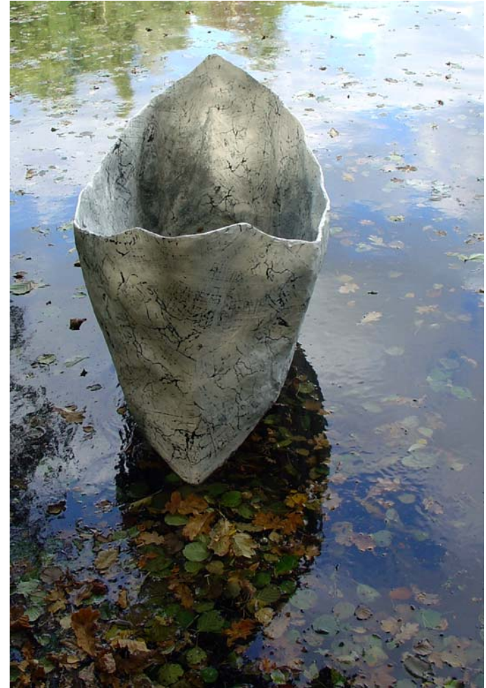
Fischerboot, schwimmend auf dem Hubertussee, Berlin, Okt. 2007