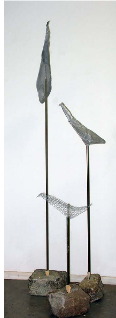
3 Vögel (1-3), 2006, Zinkdraht, Edelstahlgewebe, Alugewebe, Stäbe, Granit, 140 cm hoch