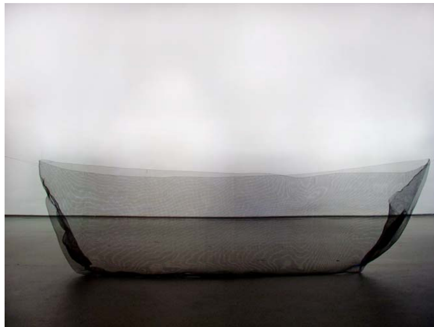
Von Ost nach West, 2005, Foto (2), Boot aus Drahtgeflecht, 100 x 300 x 85 cm Aufbau der Installation zur Biennale VI in Krasnoyarsk, Sibirien