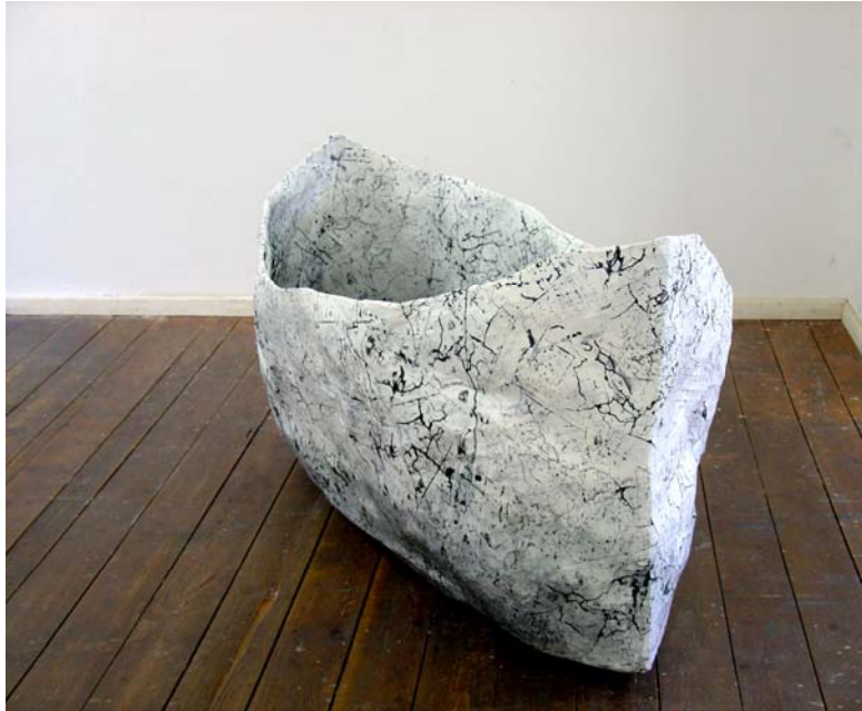
Fischerboot, 2007, Draht, Papier mit Linien gestempelter Landkarten, 155 x 75 x 75 cm, Atelierfoto