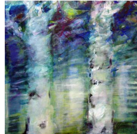
zwei Birken, 2009, Acryl auf Lw., 100 x 100 cm