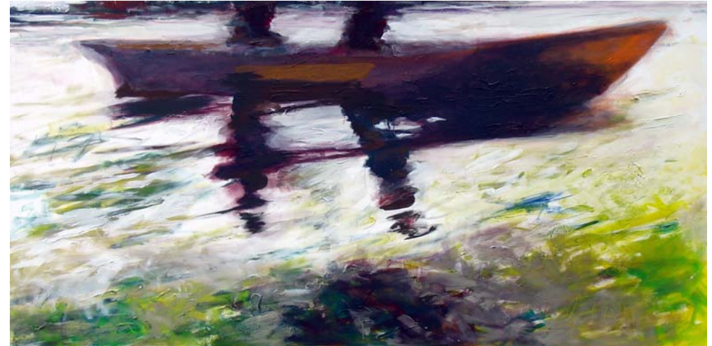
dunkles Boot, 2009, Acryl auf Lw., 150 x 300 cm

Wohl sucht sie das Naturerleben und findet es in ihrem am nördlichen Stadtrand gelegenen Atelier im Künstlerhof Frohnau. Aber die Kunst von Gudrun Fischer-Bomert ist mit dieser erlebnisaktuellen Wahrnehmungsebene nicht ausreichend erfasst. Vielmehr enthält sie auch weitere Schichten oder Dimensionen, die von lebensgeschichtlichen Ereignissen geprägt oder von der Auseinandersetzung mit dem abendländischen Bildungsgut,