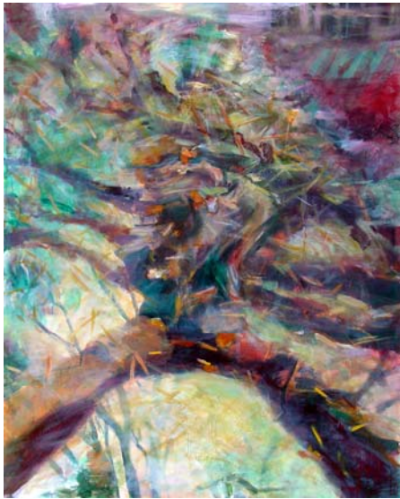
Wasserspiegel, 2009, Acryl und Öl auf Lw., 125 x 100 cm