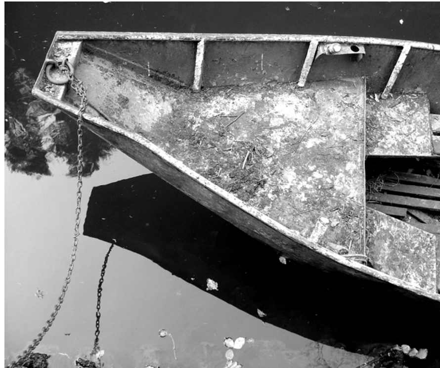
Spiegelung, 2009, Foto