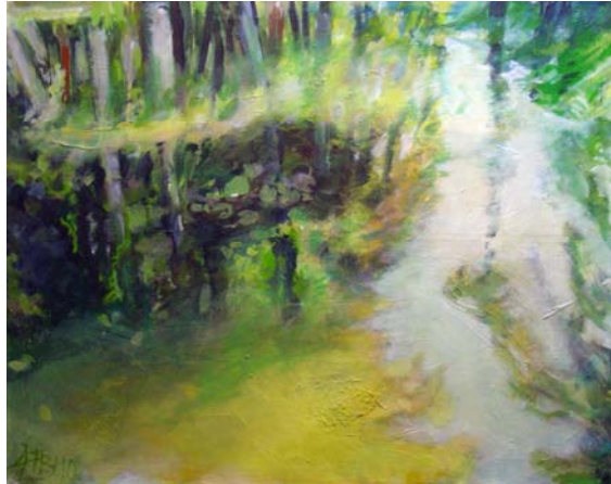
Arabischer Garten, 2010, Acryl und Öl auf Lw., 100 x 125 cm

„Wer sich nur von den Bildern, die hier auf der Bürgermeisteretage im Rathaus Reinickendorf hängen, ein Bild vom Schaffen der Künstlerin Gudrun Fischer-Bomert machen will, muss den Eindruck gewinnen, dass diese die weiträumige und menschenleere Einsamkeit liebt und sich von Nebelschwaden und Regenschleiern vor dunklen Waldfronten inspirieren lässt. In den hier gezeigten großformatigen Landschaftsbildern laufen einsame Wegbänder in eine ferne Unbestimmtheit und die aufrechten Baumstämme, die ein Waldgrün strukturieren und eine Wasserfläche umrahmen, wirken still und erhaben und manchmal auch ein wenig bedrohlich.