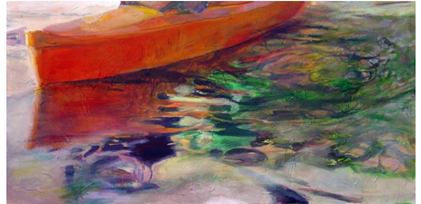
Bewegte Wasser 2, 2010, Acryl auf Lw., 80 x 160 cm