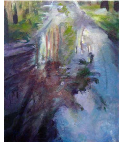
Fahrs pur 1 und 2, 2010, Acryl und Öl auf Lw., je 125 x 100 cm