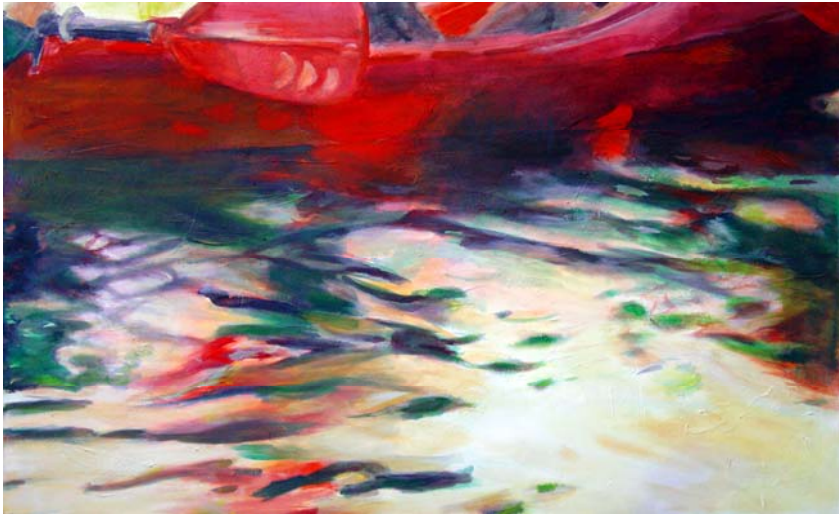
Bewegte Wasser 3, 2010, Acryl auf Lw., 100 x 160 cm