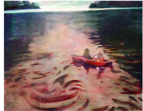
Bis zum Horizont, 2010, Acryl und Öl auf Lw., 100 x 125 cm