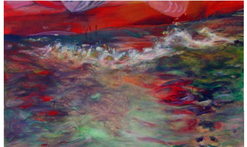
Bewegte Wasser 4, 2010, Acryl auf Lw., 100 x 160 cm