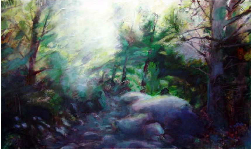
Waldstück, 2010, Acryl und Öl auf Lw., 120 x 200 cm