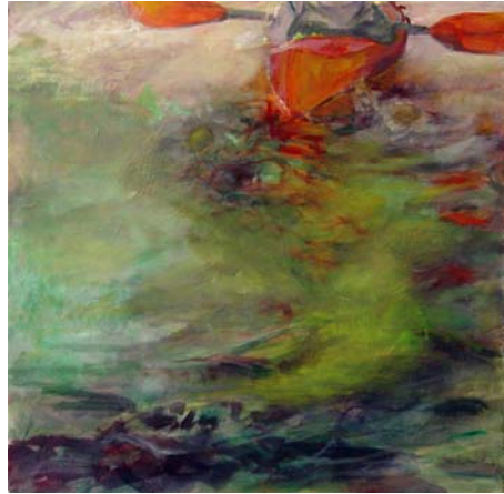
Spur von grünem Wasser, 2010, Acryl und Öl auf Lw., 100 x 100 cm