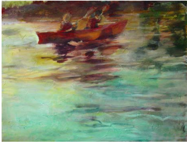
Schatten im Wasser, 2010, Acryl und Öl auf Lw., 100 x 130 cm