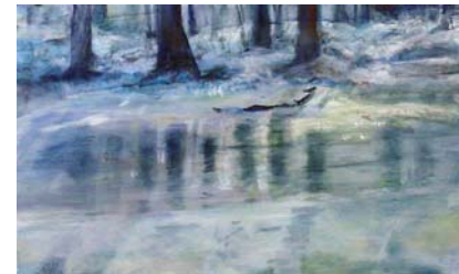
Wintersee, 2010, Acryl auf Lw., 50 x 70 cm