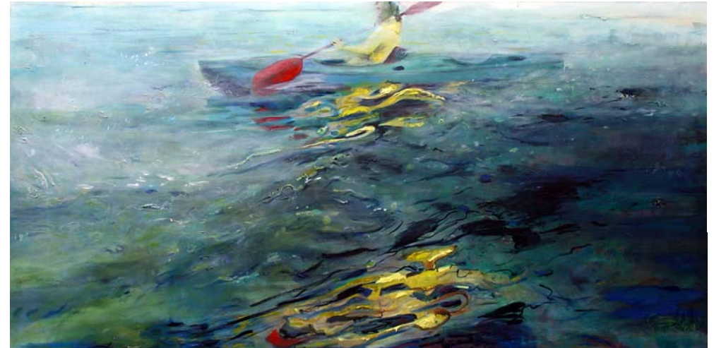
blaues Kanu, 2009, Acryl auf Lw., 150 x 300 cm