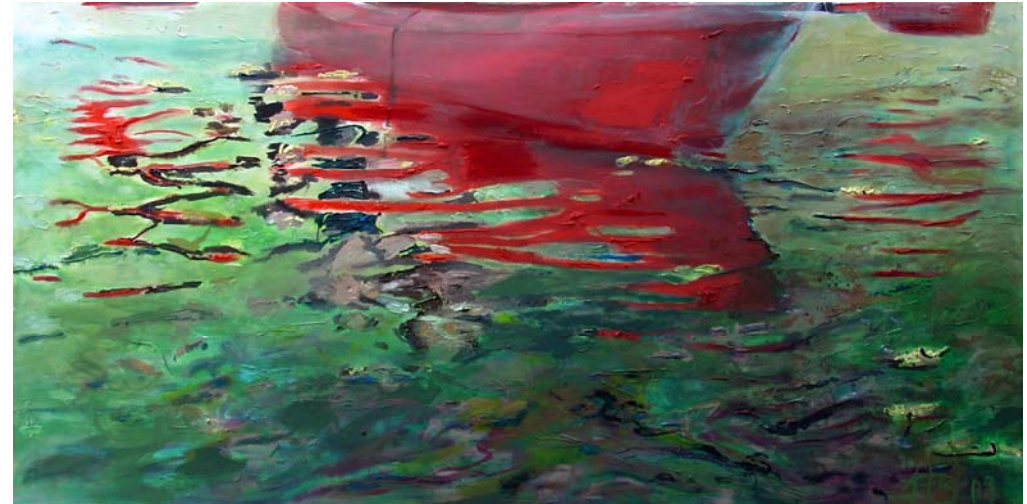
rotes Kanu, 2009, Acryl und Öl auf Lw., 150 x 300 cm