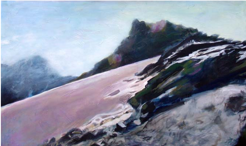
Gletscher, 2009, Acryl und Öl auf Lw., 100 x 160 cm