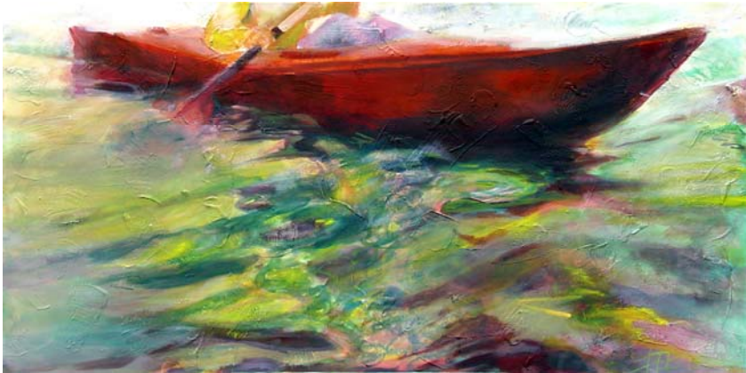
Bewegte Wasser 1, 2010, Acryl auf Lw., 80 x 160 cm